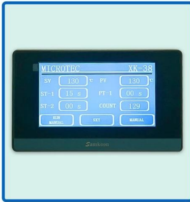
Precision PLC Control