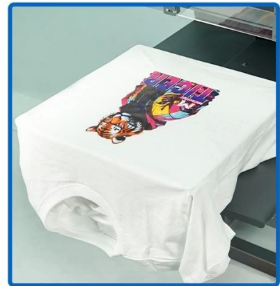
Full Slide-out Base Plate