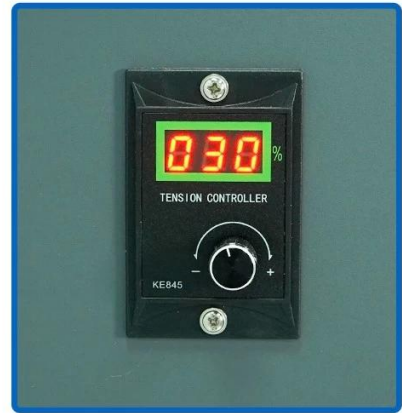
Adjustable Tension Control