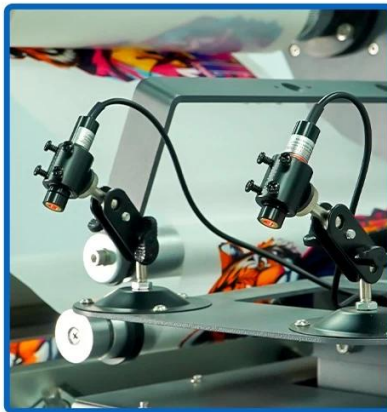
Laser Positioning System