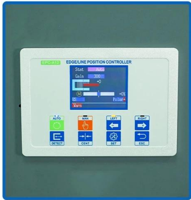
Line Position Controller