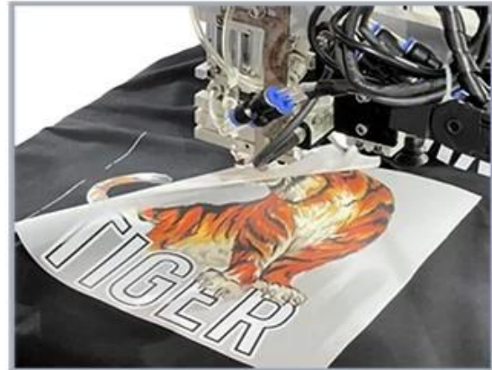
6. Robotic arm peels off the finished transfer film