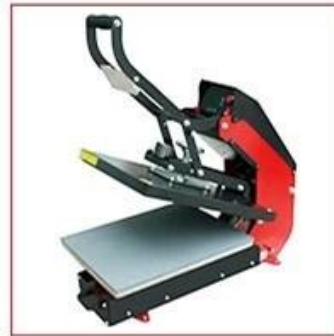
SENK 15A (15"x15"/38X38cm)