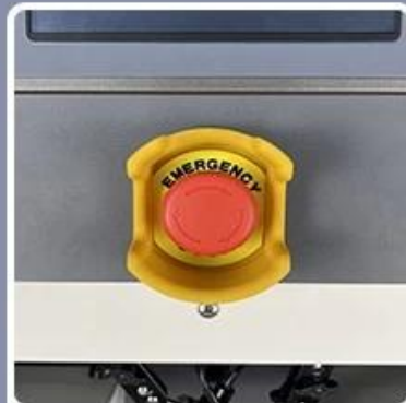
Emergency Stop Switch