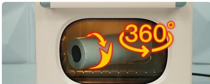
Even Heat Circulation