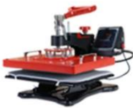
T-shirt Heat Press