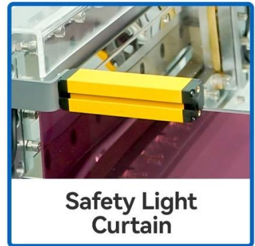
Safety Light Curtain