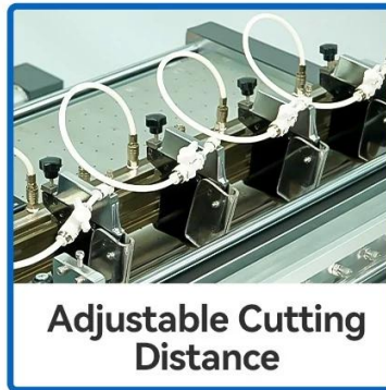
Adjustable Cutting Distance