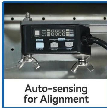
Auto-sensing for Alignment