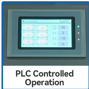
PLC Controlled Operation