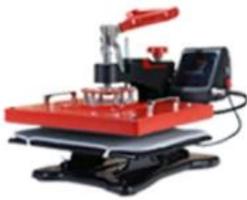
T-shirt Heat Press