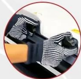
Adjustable Pressure Settings