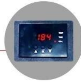
GY-04 Digital Controller: Accurate in time and temp.display