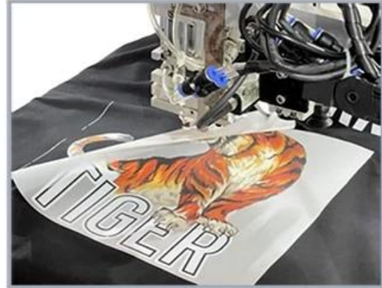
6. Robotic arm peels off the finished transfer film