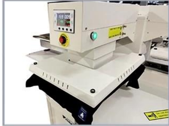
4. Heat platen is automatically pressed down for heating