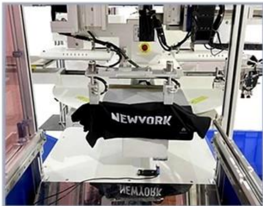
7. Automatically grabs the transferred T-shirts