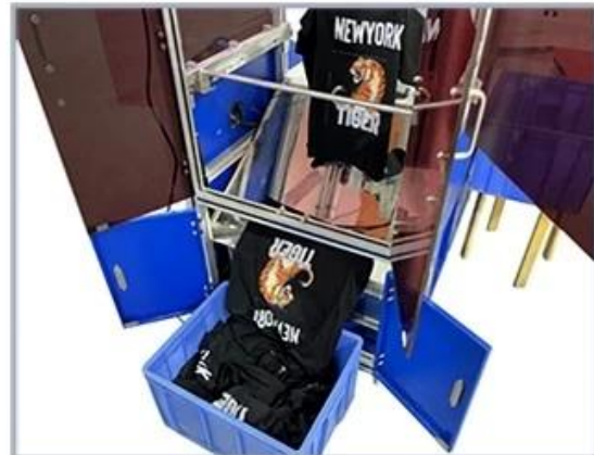
8. Placing the transferred items into the collection basket