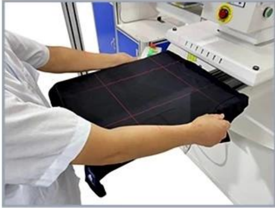
1. Place the T-shirt onto S4 automatic carousel heat press

Microtec Robotic Material Loading System and Automatic Unloading Machine represent the pinnacle of efficiency and automation, offering a comprehensive solution for businesses seeking to elevate their thermal transfer printing operations.