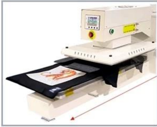
5. Time is up, the under plate is automatically slide out