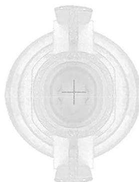
Auto-Stop Ink Bottle