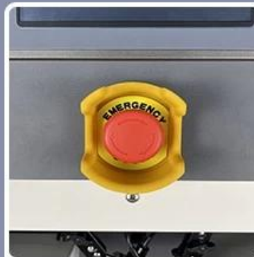
Emergency Stop Switch