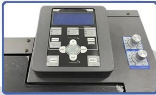
NO.2 Digital Operation Display System