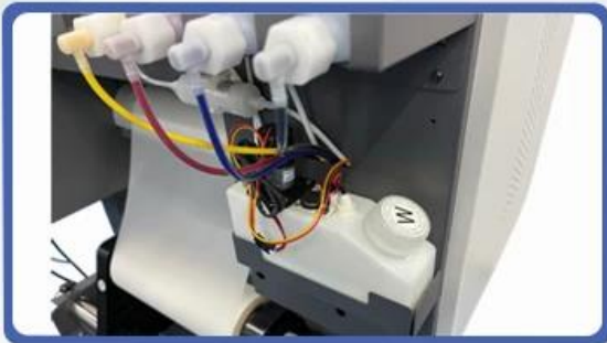
NO.3 White Ink Circulation & Stirring