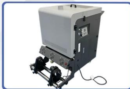
NO.6 DTF Powder Shaker with DTF Film Taking Up System