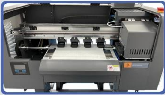
NO.1 Print Head Carriage & Heavy Pressure Roller With Rub