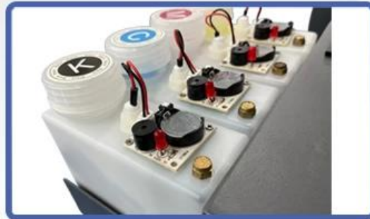
NO.4 Ink Shortage Alarm Device