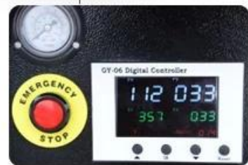
GY-06 Digital Time & Temp. Control